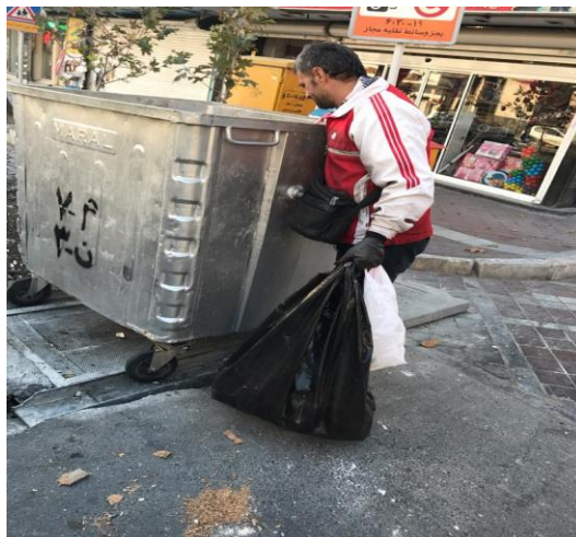
تصویر ۲. زباله‌گرد دارای اعتیاد

شب تا صبح و صبح تا شب از جلوی بیمارستان و پاساژ، وسیله و پلاستیک و کاغذ و آلومینیوم جمع می‌کنیم. بعضی شب‌ها از موم می‌دزدند شون و بی‌مواد می‌مانیم. بعضی شب‌ها هم یکی پیدا می‌شه بی دردسر همین‌جا از موم می‌خره، می‌بره و پولش تم نقد حساب می‌کنه. ما دوره‌گردیم و معتاد. شب‌ها هم هر جا گیر آوردیم، می‌خوابیم. بعضی مواقع هم از ترس یخ زدن تا صبح نمی‌خوابیم (زباله‌گرد معتاد، ۲۸ ساله).