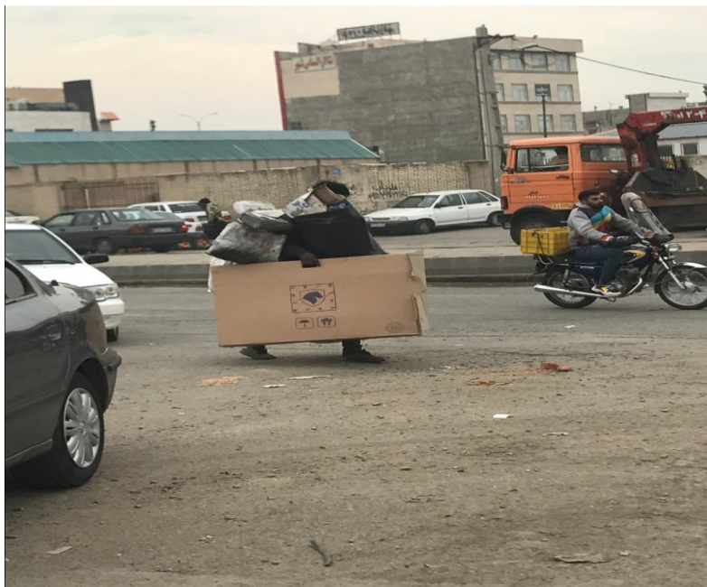
تصویر ۳. زباله‌گرد غیررسمی