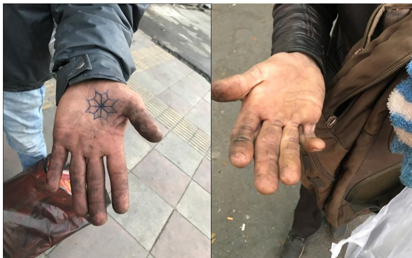
تصویر ۱. دستان زباله‌گردها

سطح درآمد و پایگاه اقتصادی-اجتماعی: زباله‌گردی شغلی است که تنها افراد فاقد مهارت شغلی، بی‌سواد و کم‌سواد، مهاجرین بی‌خانمان و بی‌مکان و افرادی که فرصت‌های شغلی بسیار ضعیفی دارند، وارد آن می‌شوند. بنابراین، پایگاه اقتصادی-اجتماعی و سطح درآمد این افراد بسیار پایین بوده-روزانه حدود ۳۰ تا ۵۰ هزار تومان- و پشتوانه مالی ندارند. کسب درآمد با این شغل، برای زباله‌گرد پیاده‌رو، برای گذران زندگی و امرار معاش می‌باشد. زباله‌گردهایی که با خودرو شخصی در پی جمع‌آوری ضایعات و پسماند خشک هستند، با این گروه‌ها متفاوت بوده و وضعیت بهتری دارند.