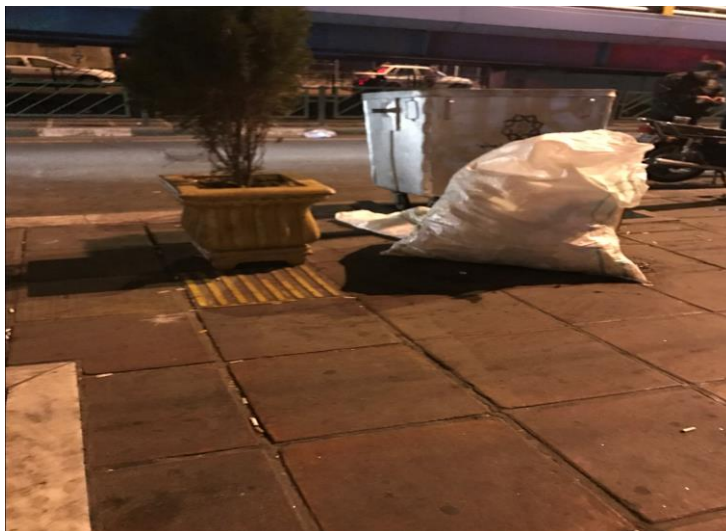
تصویر ۴. جابار ۱